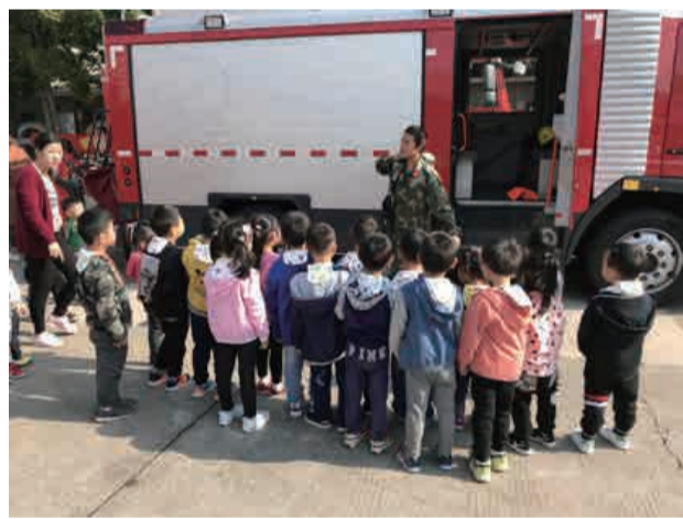
参观消防车，身穿消防服，尝试消防水管，一系列的活动让孩子们了解到每辆消防车的功能各有不同，各司其职。