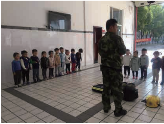
活动中孩子们惊叹不已，他们在了解消防知识的同时，还体会到消防叔叔工作的辛苦和危险，让孩子们懂得保护自身安全不仅是保护自己也是避免让消防员叔叔涉入更多的危险中去。