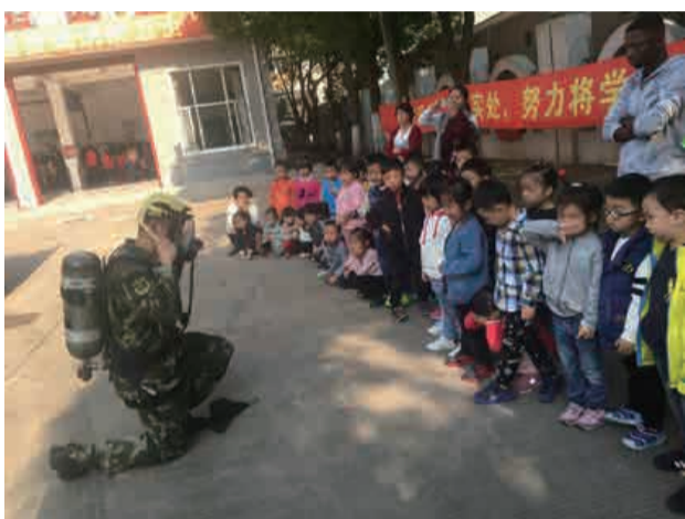
消防叔叔为孩子们表演了1分钟整装出发，滑竿下楼，快速穿上消防服等日常训练事务，井然有序、干净利落的动作处处体现出消防队员们日常训练有素。