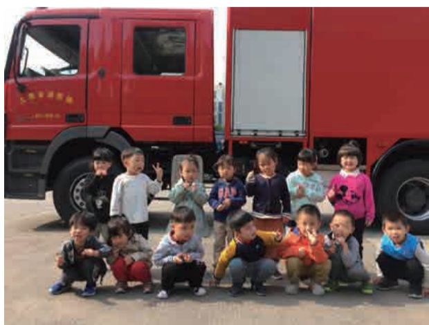
11月13日，田田幼儿园的孩子们走进奉浦消防支队，近距离了解消防灭火那点事，参观消防车大揭秘。